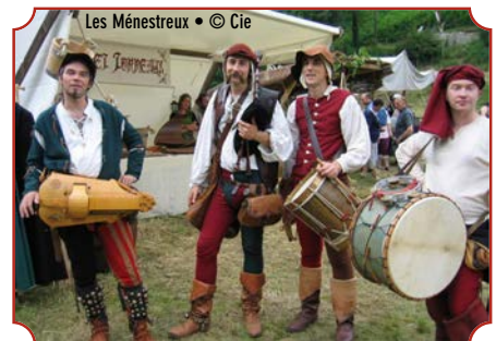
Les Ménestreaux