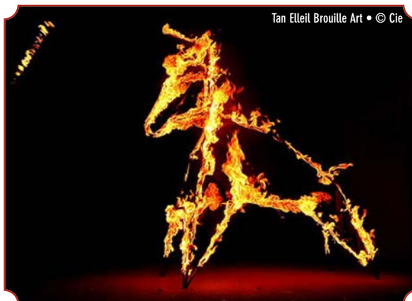
Tan Elleil Brouille Art • © Cie

"Flammes éphémères", par Tan Elleil Brouille Art et Cie