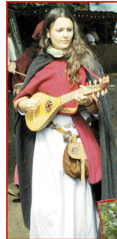
Deux des musiciennes du groupe Bella Sorte

L'élément patrimonial essentiel d'Armillac est son église : datée du XV e siècle, elle est caractérisée par un clocher-arcade à trois baies, une façade s'appuyant sur des contreforts et une abside semi-circulaire.