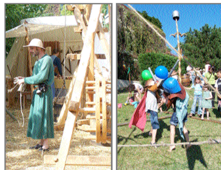
en haut — Les Dragons du Cormyr au centre — Les musiciens de Waraok ci-dessus — Dans l'Œil du Compas • Jeux de la Cie Vrehnd