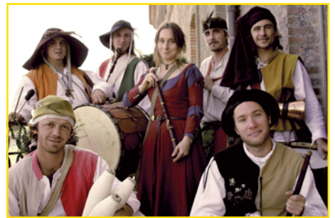
Le groupe Tornals