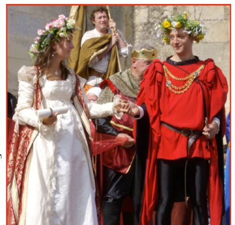
Scènes du mariage de Madeleine